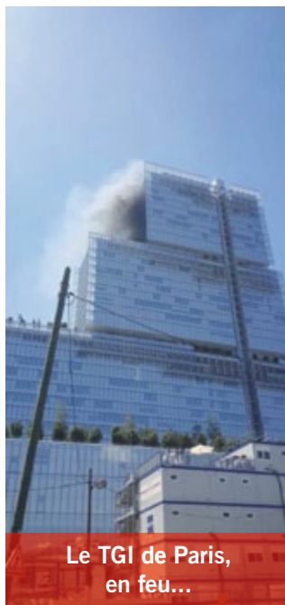
Le TGI de Paris, en feu...

Composés des représentants désignés par les organisations syndicales de fonctionnaires et magistrats, et des représentants de l'administration, ils se réunissent au moins trois fois par an.